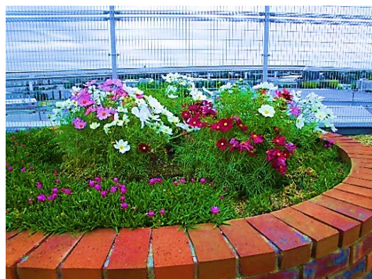
今はコスモスですよ！