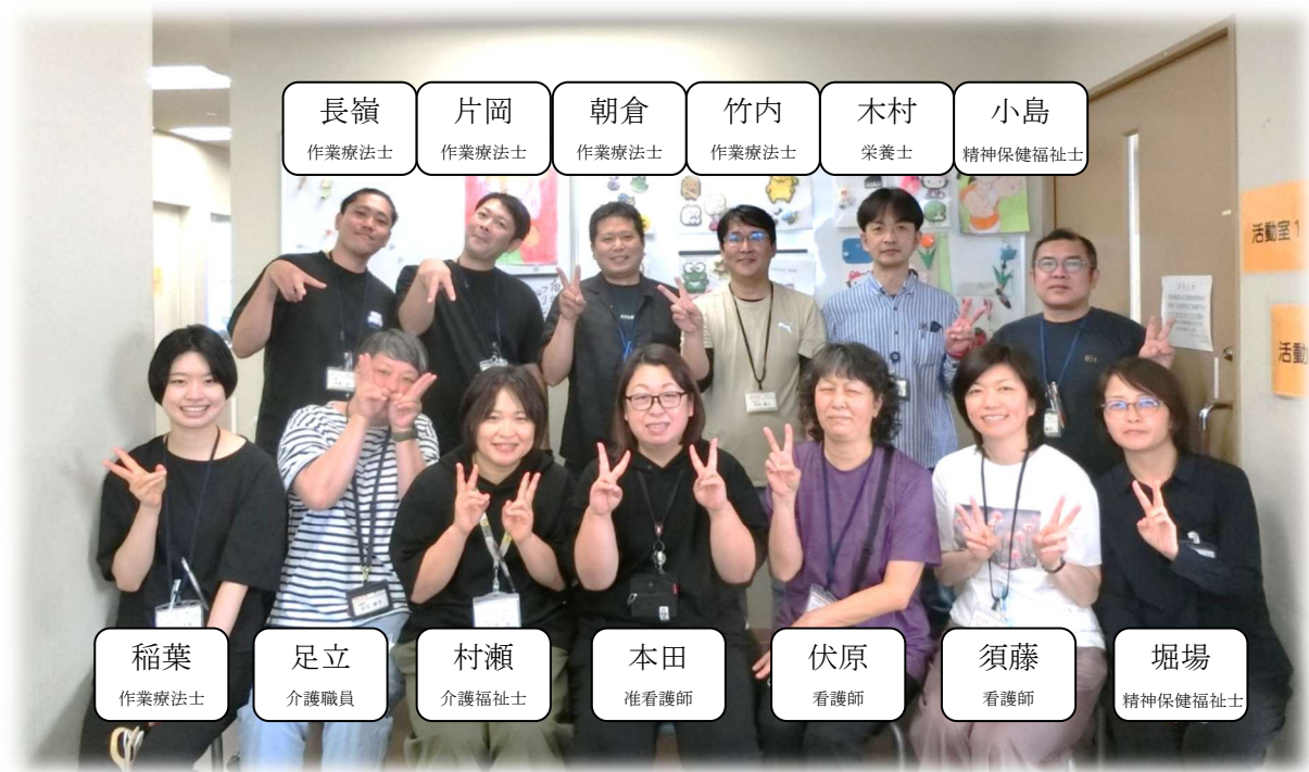
(職員一同 本年度もよろしくお願ひいたします)

発行：グループホーム あしび 474-0071 大府市梶田町二丁目 98 番地 Tel・Fax 0562-44-8204 E-mail ashibi@kyowa.or.jp