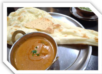
（クシイのナンカレーランチ）