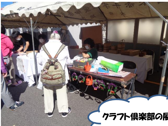
クラフト倶楽部の展示！

ピアサークルのメンバーさんは、パンフレットを配り歩いたり、積極的に声をかけたいしながら頑張っていました。午前中で100枚配り終え、午後はフランクフルトや焼きそばなどを食べて、祭りを満喫しておりました！写真は撮り忘れたのでイラストでどうぞ！